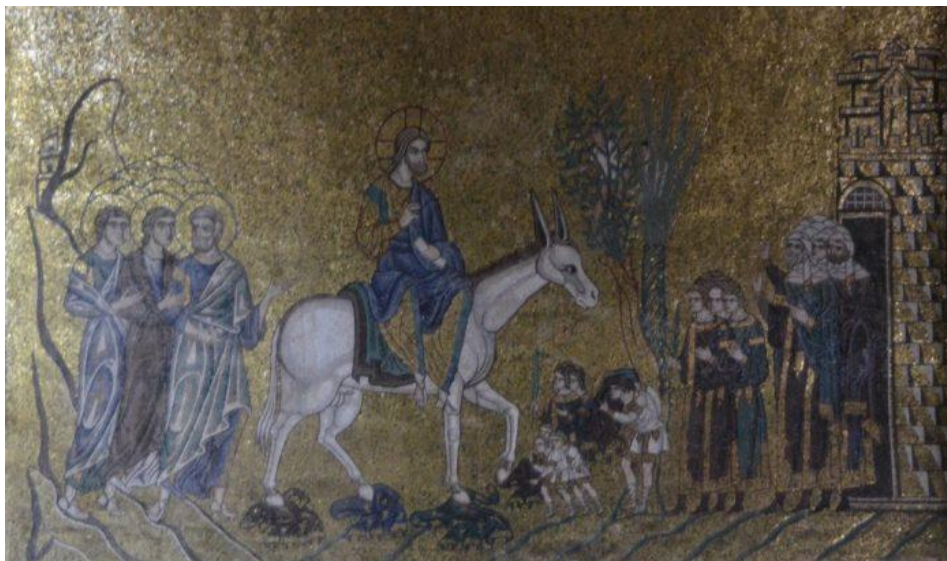
Entrata di Cristo in Gerusalemme - Basilica di San Marco, Venezia

In ottemperanza al Decreto della Presidenza del Consiglio dei Ministri del 8 marzo 2020 e in accordo con le disposizioni del Patriarca – in comunione con i Vescovi del Nordest – del 8 marzo 2020, non potendo celebrare pubblicamente, i fedeli sono invitati ad assolvere il precetto festivo, dedicando un tempo conveniente alla preghiera e alla meditazione, eventualmente anche servendosi del seguente schema.