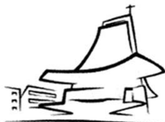
Festa parrocchiale Sacro Cuore Insieme

- Ore 20,30 Musicol “San Massimiliano Kolbe”